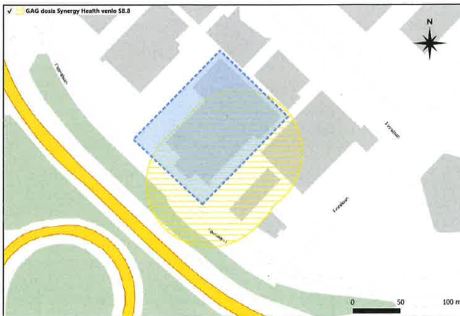
Figuur 3.3: Gifwolkaandachtsgebied Synergy Health Ede B.V. – locatie Venlo

Binnen het brandaandachtsgebied zijn geen (beperkt) kwetsbare gebouwen of locaties gelegen. Wel kunnen binnen dit gebied geprojecteerde beperkt kwetsbare gebouwen worden gerealiseerd. Binnen het gifwolkaandachtsgebied zijn wel beperkt kwetsbare gebouwen gelegen.